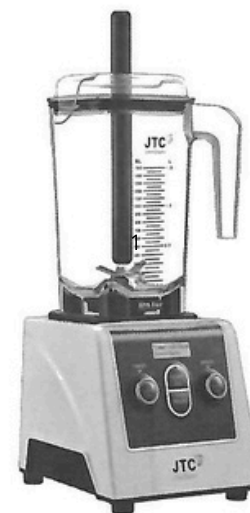
MODELE : 900D

Gagnez du temps grâce aux cycles pré-programmés. Une seule touche suffit.